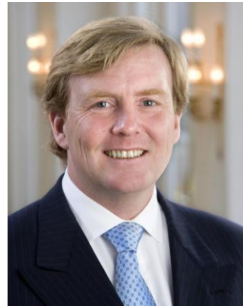
Willem-Alexander 4 punten