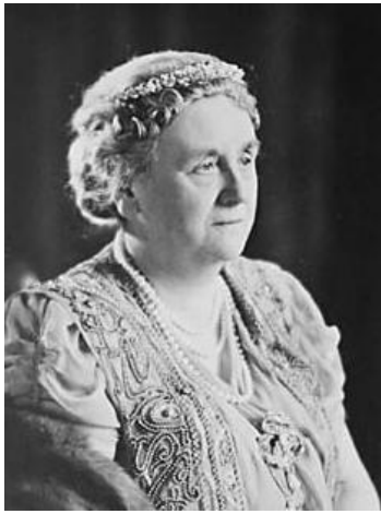
Wilhelmina 7 punten