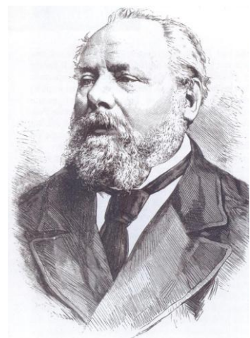
Willem III 8 punten