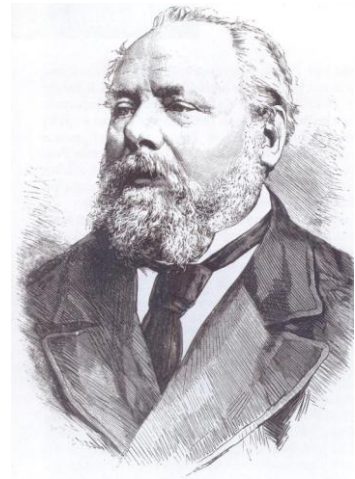
Willem III 8 punten