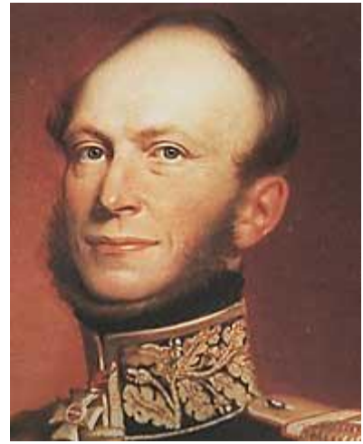
Willem II 9 punten