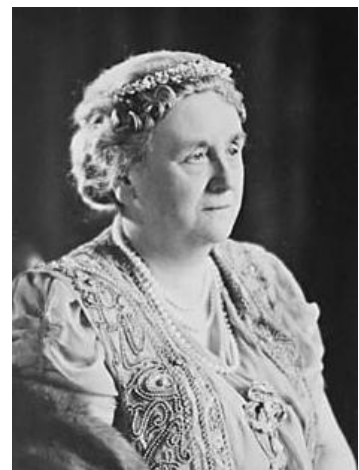
Wilhelmina 7 punten