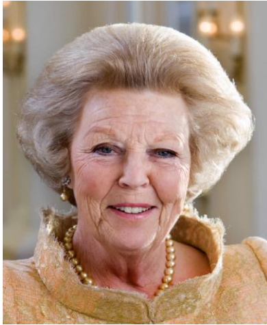
Beatrix 5 punten