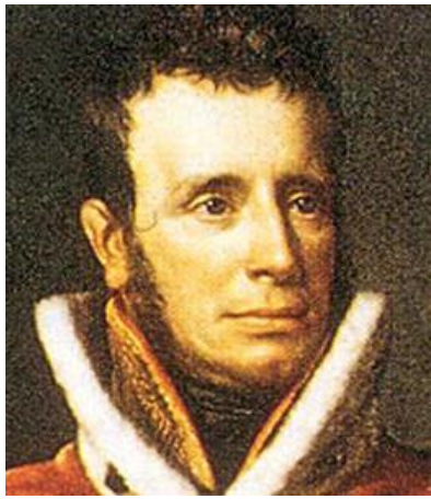
Willem I 10 punten