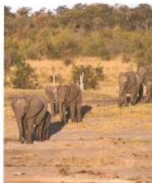
Van alle dieren die op het land leven, is de Afrikaanse olifant de grootste.