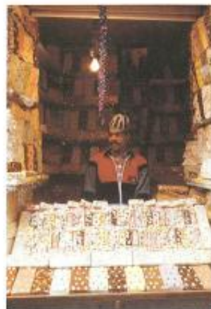
Mmm, dat ziet er lekker uit!