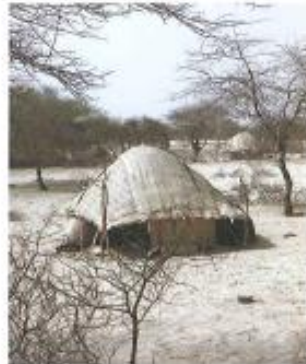
Het regent zelden in Mali. Op vele plaatsen groeit zelfs geen grassprietje!