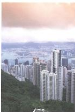
De wolkenkrabbers van Hongkong.