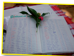
Aflatoun spaarboek van een klas uit de Filippijnen (Lees meer op www.planstation.nl/Planeet+Plan/Filippijnen/Meer+Info/Handel+en+Geld )