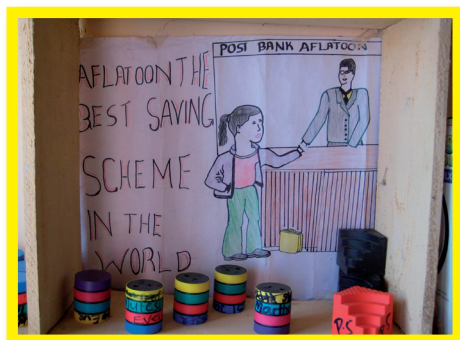
De 'bank' waar de spaarpotten worden bewaard in de klas (Uganda).

Kijk maar eens in je spaarpot uit welke landen jouw euro's komen!