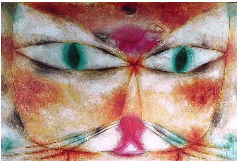
Kat en vogel, 1929 olieverf en inkt op doek, Paul Klee