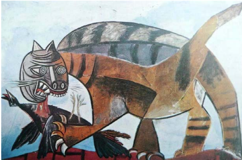
Kat die een vogel verslindt, 1939 olieverf op doek, Pablo Picasso

Projecteer de afbeeldingen van de kunstwerken met behulp van een digibord of zorg voor A4 of A3 kleurenkopieën.