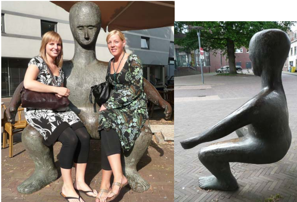
Op schoot in Amersfoort, 2003 brons, Henk Visch

Projecteer de afbeeldingen van de kunstwerken met behulp van digibord of zorg voor A4 of A3 kleurenkopieën.